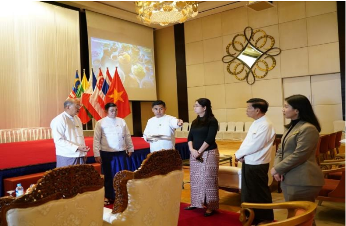
နေပြည်တော်၊ ဩဂုတ်လ ၁၆ ရက်