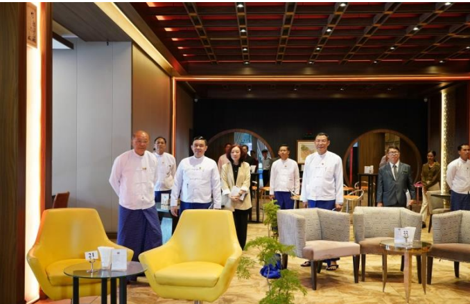
နေပြည်တော်၊ ဩဂုတ်လ ၂၆ ရက်