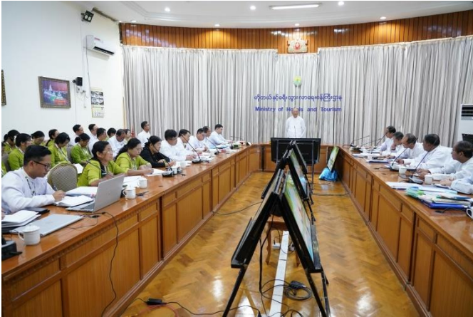
နေပြည်တော်၊ ဩဂုတ်လ ၁ ရက်

အားကစားနှင့်လူငယ်ရေးရာဝန်ကြီးဌာနနှင့် ဟိုတယ်နှင့်ခရီးသွားလာရေးဝန်ကြီးဌာန ပြည်ထောင်စုဝန်ကြီး Jeng Phang နော်တောင်သည် ယနေ့ နံနက်ပိုင်းတွင်ဟိုတယ်နှင့်ခရီးသွားလာရေးဝန်ကြီးဌာန၊ နီလာခန်းမ၌ဝန်ကြီးဌာနမှအဆင့်မြင့်အရာရှိကြီးများ၊ ဌာနတာဝန်ခံများ၊ အရာထမ်းများနှင့်တွေ့ဆုံပါသည်။