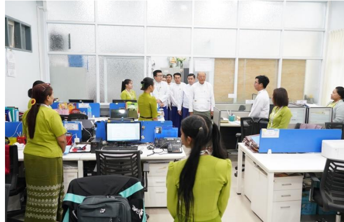
နေပြည်တော်၊ ဩဂုတ်လ ၄ ရက်

အားကစားနှင့်လူငယ်ရေးရာဝန်ကြီးဌာနနှင့် ဟိုတယ်နှင့်ခရီးသွားလာရေးဝန်ကြီးဌာန ပြည်ထောင်စုဝန်ကြီး Jeng Phang နော်တောင်သည် ယနေ့နံနက်ပိုင်းတွင် ဟိုတယ်နှင့်ခရီးသွားလာရေးဝန်ကြီးဌာန ဝန်ကြီးရုံးနှင့် ဟိုတယ်နှင့်ခရီးသွားညွှန်ကြားမှုဦးစီးဌာနတို့ရှိ ဌာနခွဲများအလိုက် ဝန်ထမ်းများ၏ ရုံးတက်ရောက်နေမှုအခြေအနေများ၊ ရုံးလုပ်ငန်းဆောင်ရွက်နေမှုအခြေအနေများ၊ ရုံးအတွင်းအပြင်နှင့်ရုံးပတ်ဝန်းကျင်သန့်ရှင်း သာယာလှပရေးဆောင်ရွက်ထားရှိမှု အခြေအနေများ၊ နိုင်ငံပိုင်ရုံးလုပ်ငန်း သုံးပစ္စည်းများ စနစ်တကျသိမ်းဆည်းထားရှိမှုအခြေအနေများကို ကြည့်ရှုစစ်ဆေးပါသည်။