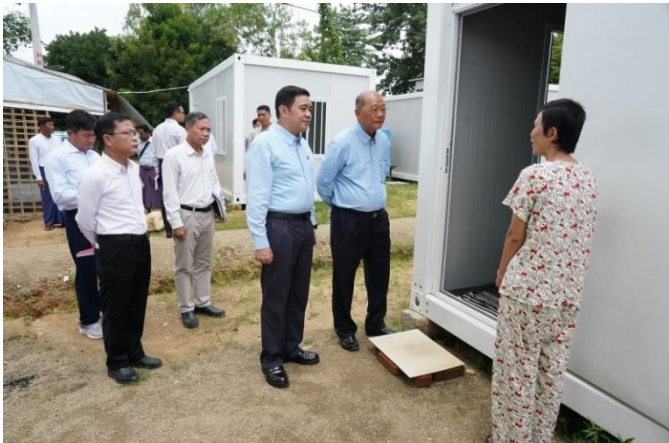
နေပြည်တော်၊ ဩဂုတ်လ(၉)ရက်

အားကစားနှင့်လူငယ်ရေးရာ ဝန်ကြီးဌာနနှင့်ဟိုတယ်နှင့်ခရီးသွားလာရေးဝန်ကြီးဌာန၊ ပြည်ထောင်စု ဝန်ကြီး Jeng Phang နော်တောင်သည် ယနေ့ နံနက်ပိုင်းတွင်ဒုတိယဝန်ကြီး ဦးဖြိုးဇော်စိုး၊ ဒုတိယအမြဲတမ်းအတွင်းဝန်နှင့် အဆင့်မြင့်အရာရှိကြီးများလိုက်ပါလျက်ပြည်ထောင်စုနယ်မြေနေပြည်တော်၊ ဒက္ခိဏသီရိမြို့နယ်၊ ဟိုတယ်ဆိုင်ရာလုပ်ငန်းရှင်များအသင်း၏ ရုံးဝန်းအတွင်း၌ ဝန်ကြီးဌာနမှ ငလျင်ဒဏ်သင့် ဝန်ထမ်း များနှင့် မိသားစုဝင်များ ယာယီနေထိုင်နိုင်ရန်အတွက် အမျိုးသားသဘာဝ ဘေးအန္တရာယ်ဆိုင်ရာစီမံခန့်ခွဲမှုကော်မတီက ခွဲဝေချထားပေး သည့် အိပ်ခန်းတစ်ခန်းပါ Container Houseများနှင့်ယာယီနေထိုင်သည့် နေရာများသို့ လှည့်လည်ကြည့်ရှု စစ်ဆေးပါသည်။