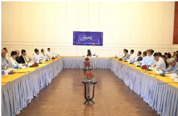
နေပြည်တော်၊ ဩဂုတ်လ ၁၅ ရက်

မြန်မာနိုင်ငံ၏ ဟိုတယ်နှင့်ခရီးသွားလုပ်ငန်းများ စနစ်တကျရေရှည် ဖွံ့ဖြိုးတိုးတက်လာ ရေးအတွက် အစိုးရ-ပုဂ္ဂလိက ပူးပေါင်းဆောင်ရွက်မှုဖြင့် အကောင်အထည်ဖော်ဆောင်ရွက် လျက်ရှိရာ အားကစားနှင့်လူငယ်ရေးရာ ဝန်ကြီးဌာနနှင့် ဟိုတယ်နှင့်ခရီးသွားလာရေးဝန်ကြီးဌာန၊ ပြည်ထောင်စု ဝန်ကြီး Jeng Phang နော်တောင်သည် ယနေ့ နံနက်ပိုင်းတွင် ဒုတိယဝန်ကြီး ဦးဖိုးဇော်စိုးနှင့် တာဝန်ရှိသူများ လိုက်ပါလျက် ရန်ကုန်မြို့ရှိ ဟိုတယ်နှင့် ခရီးသွားလာရေးဝန်ကြီးဌာနနှင့် ဖက်စပ်လုပ်ကိုင် ဆောင်ရွက်လျက်ရှိသော အင်းလျားလိတ်ဟိုတယ်သို့ သွားရောက်ကာ ဟိုတယ်ဝင်းအတွင်း/အပြင် သန့်ရှင်းသာယာလှပရေးနှင့် ဝန်ဆောင်မှုပေးနေမှု အခြေအနေများ၊ ဟိုတယ် အဆင့်အတန်းနှင့်အညီ ခင်းကျင်းထားရှိသည့် ဟိုတယ်သုံးနှင့်ဆက်စပ် ပစ္စည်းများ၊ စားသောက်ဆိုင်များ၊ စားသောက်ခန်းမများ၊ ရေကူးကန်၊ အား ကစားခန်းမနှင့် အရေးပေါ်ဆေးခန်းထားရှိမှုအခြေအနေတို့ကို ကြည့်ရှု စစ်ဆေးပြီး တန်ဖိုးနှင့်ကိုက်ညီမှုရှိသော ဝန်ဆောင်မှုများကို ပေးနိုင်ရေး ဆောင်ရွက်ကြရန်၊ စည်းမျဉ်း/စည်းကမ်း များနှင့်အညီ လုပ်ငန်းများ ဆောင် ရွက်ကြရန်၊ အရည်အချင်းရှိသော ဟိုတယ်ဝန်ထမ်းများ များပြားလာစေရေး စဉ်ဆက်မပြတ် ပြုစုပျိုးထောင်ကြရန်နှင့် အစားအစာများအားသန့်ရှင်း လတ်ဆတ်ပြီး ကျန်းမာရေးနှင့်ညီညွတ်မှုရှိစွာပြင်ဆင်ညှိနှိုင်းကြရန် တာဝန် ရှိသူများအား မှာကြားခဲ့ပါသည်။