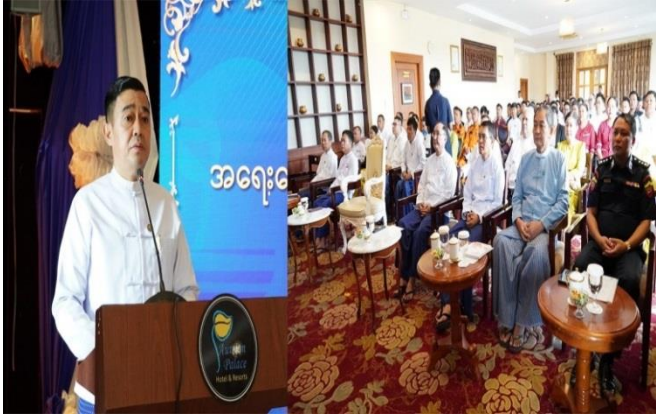
နေပြည်တော်၊ ဇွန်လ (၁၁) ရက်