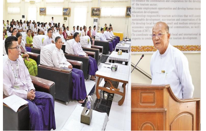
နေပြည်တော်၊ ဩဂုတ်လ ၁၈ ရက်

ဟိုတယ်နှင့်ခရီးသွားလုပ်ငန်းကဏ္ဍတွင် လူ့စွမ်းအားအရင်းအမြစ် ဖွံ့ဖြိုးတိုးတက်လာစေရန်၊ ဟိုတယ်နှင့်ခရီးသွားဆိုင်ရာ ကျွမ်းကျင်ပညာရှင်များပေါ်ထွန်းလာစေရန်နှင့် ပြည်တွင်း/ ပြည်ပ ခရီးသွားဧည့်သည်များကို နိုင်ငံတကာအဆင့်မီ ပြည့်စုံကောင်းမွန်သည့် ဝန်ဆောင်မှုများပေးစွမ်းနိုင်ရေးအတွက် ပညာရေးဝန်ကြီးဌာနနှင့် ဟိုတယ်နှင့်ခရီးသွားလာရေးဝန်ကြီးဌာနတို့၏ ပူးပေါင်းစီမံမှုဖြင့် မန္တလေးမြို့၊ မန္တလာတက္ကသိုလ်နှင့် ရန်ကုန်မြို့၊ အမျိုးသားစီမံခန့်ခွဲမှုပညာဒီဂရီကောလိပ်တို့တွင် ခရီးသွားလုပ်ငန်းနှင့်ဧည့်ဝန်ဆောင်မှုဆိုင်ရာစီမံခန့်ခွဲမှု ဘာသာရပ်အထူးပြုပထမနှစ်ကျောင်းကို ဖွင့်လှစ်သင်ကြားပေးလျက်ရှိရာဟိုတယ်နှင့်ခရီးသွားလာရေးဝန်ကြီးဌာနပြည်ထောင်စုဝန်ကြီး Jeng Phang နော်တောင်သည် နေပြည်တော်သို့ လေ့လာရေးခရီးစဉ်ရောက်ရှိနေသည့်မန္တလာတက္ကသိုလ်မှခရီးသွားလုပ်ငန်းနှင့်ဧည့်ဝန်ဆောင်မှုဆိုင်ရာစီမံခန့်ခွဲမှုဘာသာရပ် အထူးပြုပထမနှစ် ကျောင်းသား/ ကျောင်းသူများအား ယနေ့မွန်းလွဲပိုင်းတွင်ဝန်ကြီးဌာန၊ ကျောက်စိမ်းခန်းမ၌တွေ့ဆုံခဲ့ပါသည်။