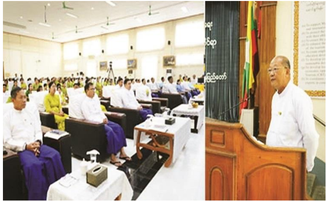
နေပြည်တော်၊ ဩဂုတ် ၂၁

ဟိုတယ်နှင့်ခရီးသွားလာရေးဝန်ကြီးဌာနနှင့် အဂတိလိုက်စားမှု တိုက်ဖျက်ရေးကော်မရှင်တို့ ပူးပေါင်းဆောင်ရွက်သည့် အဂတိလိုက်စားမှု တိုက်ဖျက်ရေးဆိုင်ရာ အသိပညာပေး ရှင်းလင်းဆွေးနွေးခြင်းအခမ်းအနားကို ယနေ့နံနက်ပိုင်းတွင်ဟိုတယ်နှင့်ခရီးသွားလာရေးဝန်ကြီးဌာနကျောက်စိမ်းခန်းမ၌ ကျင်းပခဲ့ရာ အခမ်းအနားသို့ အားကစားနှင့်လူငယ်ရေးရာဝန်ကြီး ဌာနနှင့် ဟိုတယ်နှင့်ခရီးသွားလာရေးဝန်ကြီးဌာန၊ ပြည်ထောင်စုဝန်ကြီး Jeng Phang နော်တောင်၊ အဂတိလိုက်စားမှုတိုက်ဖျက်ရေးကော်မရှင် ဥက္ကဋ္ဌ ဦးလွင်ဦး၊ ဝန်ကြီးဌာနမှ ဒုတိယဝန်ကြီး ဦးဖြိုးဇော်စိုး၊ အဂတိ လိုက်စားမှု တိုက်ဖျက်ရေးကော်မရှင်အဖွဲ့ဝင် ဒေါ်ကြူကြူဝင်းနှင့် တာဝန်ရှိသူများ၊ ဟိုတယ်နှင့်ခရီးသွားညွှန်ကြားမှုဦးစီးဌာန ညွှန်ကြားရေးမှူးချုပ်နှင့် တာဝန်ရှိသူများ၊ ဝန်ကြီးဌာန CPU အဖွဲ့ဝင်များ၊ အရာထမ်း၊ အမှုထမ်း များပါဝင် တက်ရောက်ကြပြီး တိုင်းဒေသကြီး၊ ပြည်နယ်ရုံးခွဲများမှ ရုံးခွဲ တာဝန်ခံများနှင့်ဝန်ထမ်းများကအွန်လိုင်းမှပါဝင်တက်ရောက်ကြပါသည်။